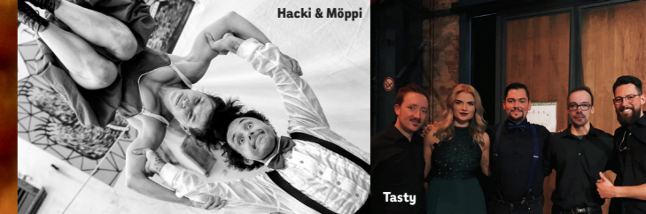
Hacki & Möppi