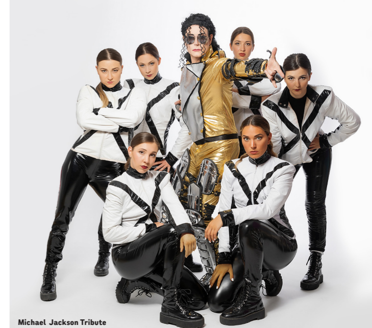
Michael Jackson Tribute