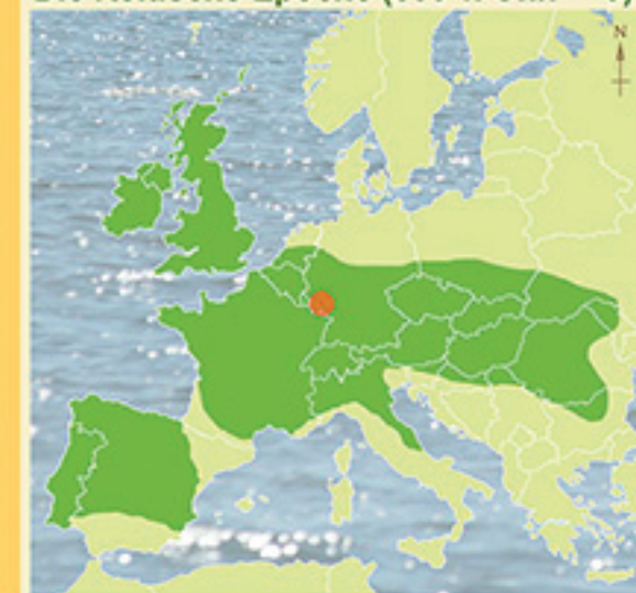
Verbreitung der keltischen Stämme um ca. 300 v. Chr.

Die 2500-jährige Kulturgeschichte des St. Wendeler Landes beginnt mit den Kelten, die uns mit dem mächtigen Ringwall von Otzenhausen und reichen Fürstengräbern herausragende Zeugnisse hinterließen. Im 4. und 3. Jahrhundert v. Chr. erweiterten sie ihren Siedlungsraum auf große Teile Europas. Bereits zu Beginn des 5. Jahrhunderts v. Chr. hatten sich die keltischen Kultur- und Machtzentren vom süddeutsch-österreichischen Raum in das Gebiet zwischen Mittelrhein, Mosel und Saar verlagert. Als Ursache werden die hiesigen Eisenvorkommen vermutet: Das besondere Wissen der Kelten um die Eisenverhüttung und ihre Schmiedekunst begründeten wahrscheinlich ihren Reichtum. Befestigte Höhensiedlungen entwickelten sich zu Machtzentren; ab dem 2. Jahrhundert v. Chr. entstanden stadtdähnliche Ansiedlungen, sogenannte Oppida.