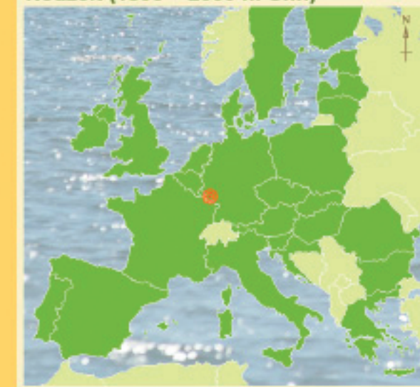
Die Europäische Union (Stand 2013)

Mit der Entdeckung Amerikas entstand der Kolonialismus. Er bildete die Grundlage für die Machtentfaltung vieler europäischer Staaten und ihre Vorherrschaft in der Welt.