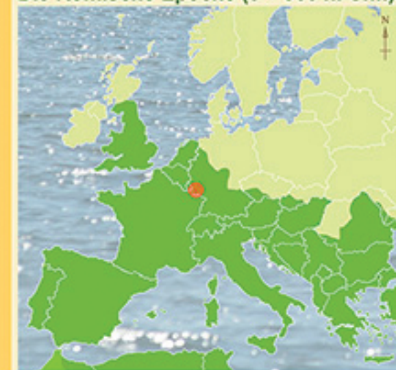
Größte territoriale Ausbreitung des Römischen Imperiums u. 117 n. Chr. (Kartenausschnitt)

Mit ihrer bewährten Eroberungsstrategie nahmen die Römer im Zuge des Gallischen Kriegs auch unsere Region etwa 500 Jahre lang in Besitz: Sie gründeten Städte als Stützen einer effektiven Verwaltung. Mit einem befestigten Straßensystem schufen sie die Voraussetzungen für einen blühenden Handel und den effektiven Einsatz des Militärs. Ein Netz von Landgütern ("Villae rusticae") sicherte die Versorgung der Bevölkerung.