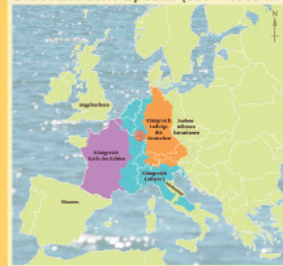
Dreiteilung des Fränkischen Reiches 843 n. Chr.

In erster Linie fränkische (= germanische) Stämme unterwarfen das römische Nordgallien und dehnten ihren Machtbereich durch fortwährende Kriege aus. So entstand das Fränkische Reich, eine für die weitere Entwicklung Europas bedeutende Großmacht in West- und Mitteleuropa. Chlodwig, ein König aus der Merowinger-Dynastie, eroberte weite Gebiete im Süden, übernahm von der gallo-römischen Bevölkerung den katholischen Glauben und stellte wichtige Weichen für die Zukunft. Der Karolinger Karl der Große rundete mit den Eroberungen im Norden den fränkischen Herrschaftsbereich ab. Mit seiner Krönung zum Kaiser in Rom war die Reichsbildung abgeschlossen.