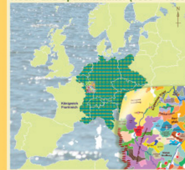
Ein Flickenteppich von über 300 Territorien (um 1400 n. Chr.)

Aus dem fränkischen Ostreich - dem späteren Deutschland - entwickelte sich das "Heilige Römische Reich" als ein loser Verbund souveräner Territorien. Unter der Führung eines Königs oder Kaisers entstanden verwirrend viele lokal regierte Gebiete, die sich im Laufe der Jahrhunderte - ebenso wie die Reichsgrenzen - beträchtlich veränderten. Allein im St. Wendeler Land gab es zehn Herrschaften. Kirchliche und weltliche Herrschaft waren eng miteinander verweben, so dass der Glaube auch als Machtinstrument diente. Zwar gab es in dieser Epoche Kriege, Kreuzzüge und Seuchen, aber auch Zeiten relativen Friedens und Wohlstands. Die aufstrebende Baukunst der Gotik versinnbildlichte das religiöse Lebensgefühl der Menschen. Minnesänger ergänzten die religiöse Dichtung erstmals mit weltlichen Themen.